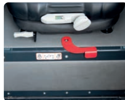
Bezpečnostní závora pracovního zařízení