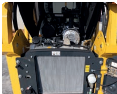
Jednoduchý přístup ke každodenním bodům údržby

Běžné úkony údržby a pravidelné prohlídky mohou být prováděny po jednoduchém otevření zadního krytu motoru. Otevření zadního krytu navíc umožňuje obsluhu přístup k chladičům a jejich snadnému čištění (chladiče jsou naklápěcí). Při speciálních úkonech údržby umožňuje sklápěcí kabina kompletní přístup k převodovce a k hlavním součástem hydraulického systému. Použití speciálních samomazných pouzder prodlužuje interval mazání všech čepů až na 250 provozních hodin.