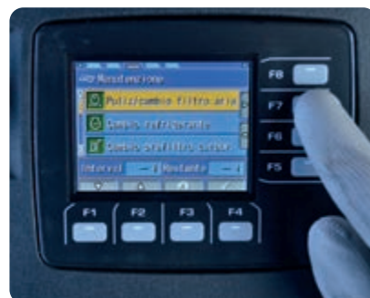
Základní obrazovka údržby na 3,5" barevném monitoru