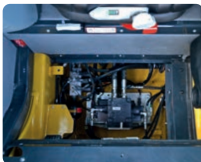
Díky krytu uvnitř kabiny lze rychle provést dodatečnou údržbu hlavního rozvaděče bez nutnosti naklápět kabinu