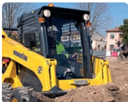
Vynikající výhled na pracovní zařízení a pracoviště