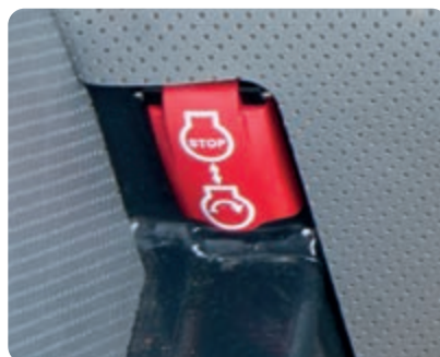
Spínač nouzového vypnutí motoru