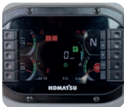
Multifunkční monitor o velikosti 7"