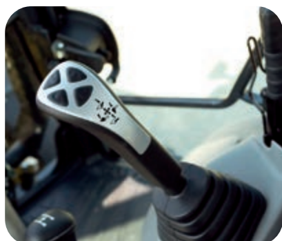
Pohodlné, ergonomické a přesné ovládání

LCD monitor o velikosti 7" poskytuje vynikající viditelnost díky vysokému rozlišení. LCD panel s vysokým rozlišením je méně nepříznivě ovlivňován pozorovacím úhlem a jasem okolního prostředí, čímž je zajištěna vynikající viditelnost. Různé výstrahy a informace o stroji jsou zobrazovány v jednoduchém formátu. K dispozici jsou také další užitečné informace, jako například provozní záznamy, informace o nastavení stroje a údaje o údržbě. Obsluha může snadno procházet stránky obrazovek pomocí intuitivně fungujících bočních tlačítek.