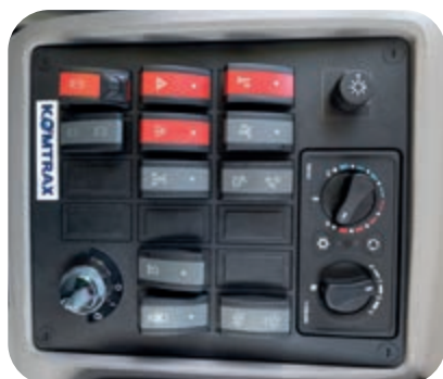
Ergonomicky navržené spínače