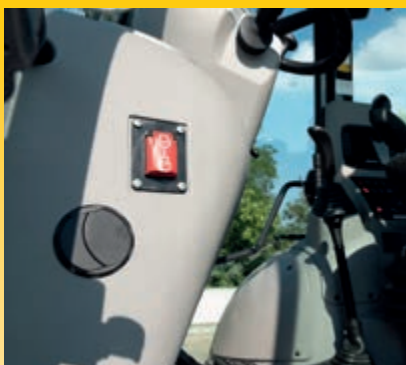
Spínač nouzového zastavení motoru