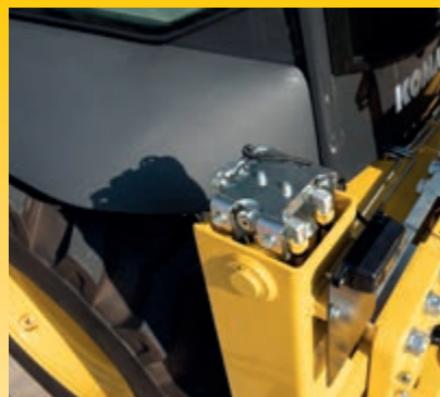
Hydraulické zámky stabilizátorů, výložníku a násady (standardní vybavení)