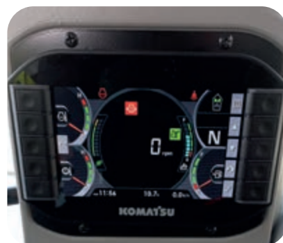
Multifunkční monitor o velikosti 7"