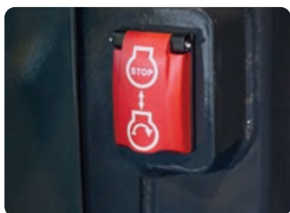
Nouzový vypínač motoru